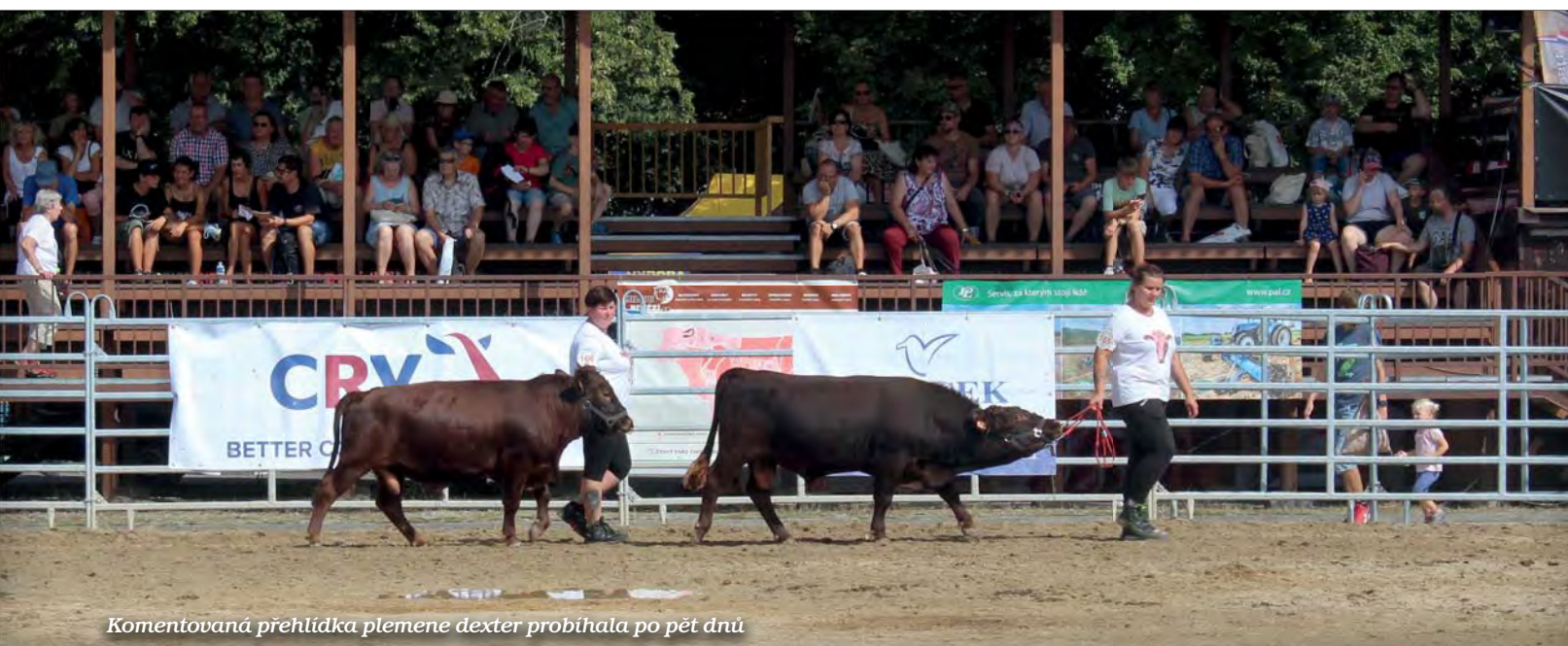
Komentovaná přehlídka plemene dexter probíhala po pět dnů