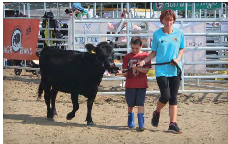
Pravidelná ukázka malého plemene dexter v předváděcí

Dexter je původně kombinovaným plemenem, ale v ČR je zaměřen výhradně na masnou užitkovost. Krávy mají v dospělosti hmotnost 270–350 kg (výjimečně až 450 kg), býci váží v dospělosti do 500 kg. Výška v kříži je u krav v rozmezí 91 až 112 cm. Býci mají v dospělosti kohoutkovou výšku 96 až 121 cm, a to podle velikosti populace. Zbarvení je nejčastěji celopláštově černé, přípustné jsou i barevné varianty red a dun (šedá). Plemeno se vyznačuje klidným temperamentem, nenáročností, přizpůsobivostí a dobrou konverzí živin. Zvířata mají relativně velkou plochu paznehtů, a tak je mož-