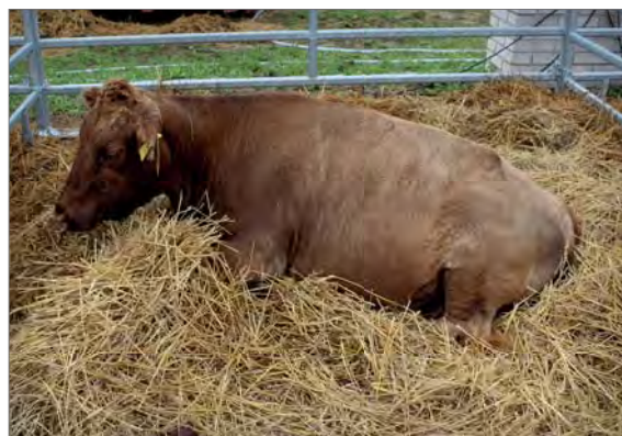
Návštěvníci si mohli všechna zvířata dexter prohlédnout v boxech