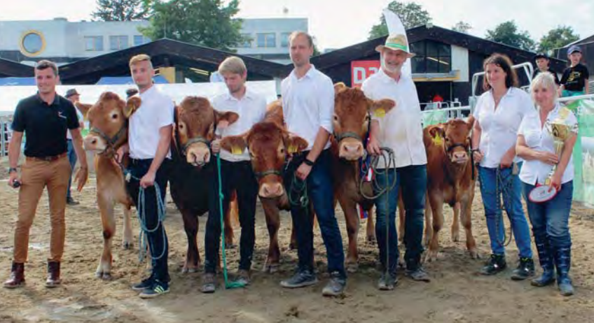
Loosovi zvítězili i v soutěži chovatelských skupin

Nejlepším teletem, národní vítězkou kategorie telat, se nakonec stala jalovička Rézi ze Sv. Kateřiny.